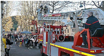
Une pluie de bonbons avec l'amicale des pompiers.

Il faisait plutôt froid samedi sur la place du Foiraal mais les Tambours de la Cesse étaient là pour réchauffer l'atmosphère. Dans une ambiance festive, l'association TéléPons avait organisé un TéléPons Games au profit de l'AFM-Téléthon. On y retrouvait un espace de jeux pour les petits et les grands, une buvette où les boissons chaudes étaient très appréciées et quelques gourmandises. L'amicale des pompiers était également présente. Du haut de la grande échelle une pluie de bonbons a été déclenchée pour le plus grand plaisir des enfants. Quant à l'associa-