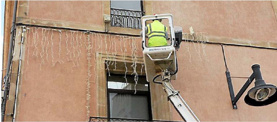
L'opération d'installation va demander encore deux semaines pour que tout soit prêt mercredi 6 décembre.

Depuis plusieurs semaines, les agents du service technique s'affairent à l'installation des illuminations de Noël. Des équipes de jour et de nuit se relaient pour mener à bien cet important dispositif de décoration. Comme chaque année, les ronds-points et avenues présenteront des multiples lumières pour transporter les habitants de la ville et des alentours. Les façades de l'hôtel de ville et de la Maison de Pays seront étincelantes, tout comme la rue de la République et ses 8 km de guirlandes qui éblouiront le ciel de la grande rue. On retrouvera le cerf lumineux et la structure extérieure photobooth sur le square Schuman. L'opération d'installation va de-