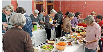
Une pause repas appréciée au cours de cette soirée cinéma.