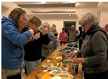
Une cinquantaine de personnes ont dégusté les soupes.

ENVIRONNEMENT. Mardi 28 novembre de 17 h 30 à 19 h la communauté de communes Grand Orb propose un atelier gratuit pour s'initier ou parfaire ses connaissances sur le compostage. Cet atelier s'adresse à tous ceux qui sont équipés ou veulent s'équiper d'un composteur individuel. Du compost sera offert aux participants à la fin de l'atelier. Atelier sur inscriptions au 04 67 23 76 66, organisé dans les locaux de Grand Orb Environnement, route de Bédarieux à La Tour-sur-Orb.