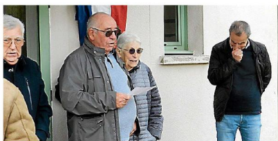
Le maire de Rieussec était entouré de ses conseillers.

Elle était conseillère municipale et faisait vivre le village au travers de son activité équestre. Les habitants voyaient souvent passer des caravanes de chevaux avec leurs cavaliers qu'Aviva emmenait en promenade. Toujours souriante, elle était également impliquée dans les activités du village, souvent présente avec un stand d'activité équestre lors de la fête du pain. Nul doute que